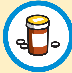
Tomar mis medicamentos