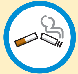
Dejar de fumar

Una manera en la que quiero mejorar mi salud es (ejemplo: tomar mis medicamentos):