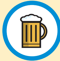
Limitar el alcohol