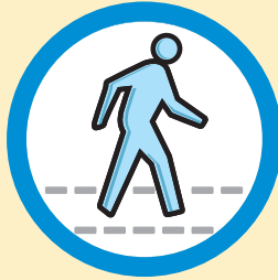
Ser activo físicamente