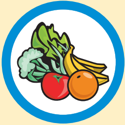
Comer una dieta saludable