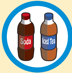
Limitar las bebidas azucaradas